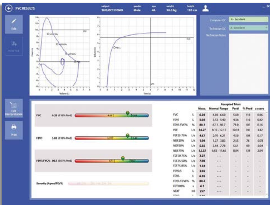
Spiropalm obrázek na obrazovce se seznamem spirometrických testů